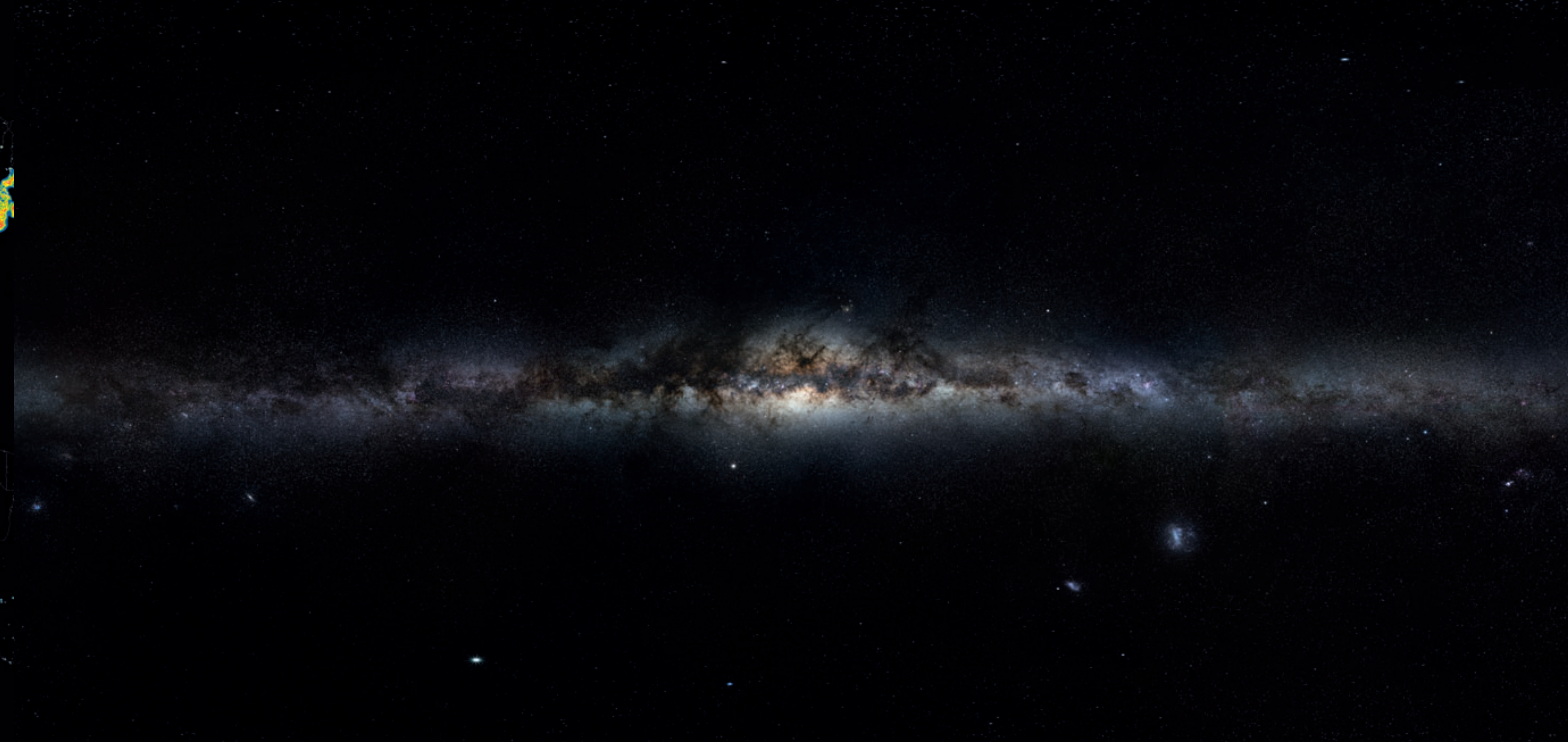
The Milky Way as seen from northern Chile, where light pollution is very low.

Atlas mundial del Cielo Nocturno con Luz Artificial.