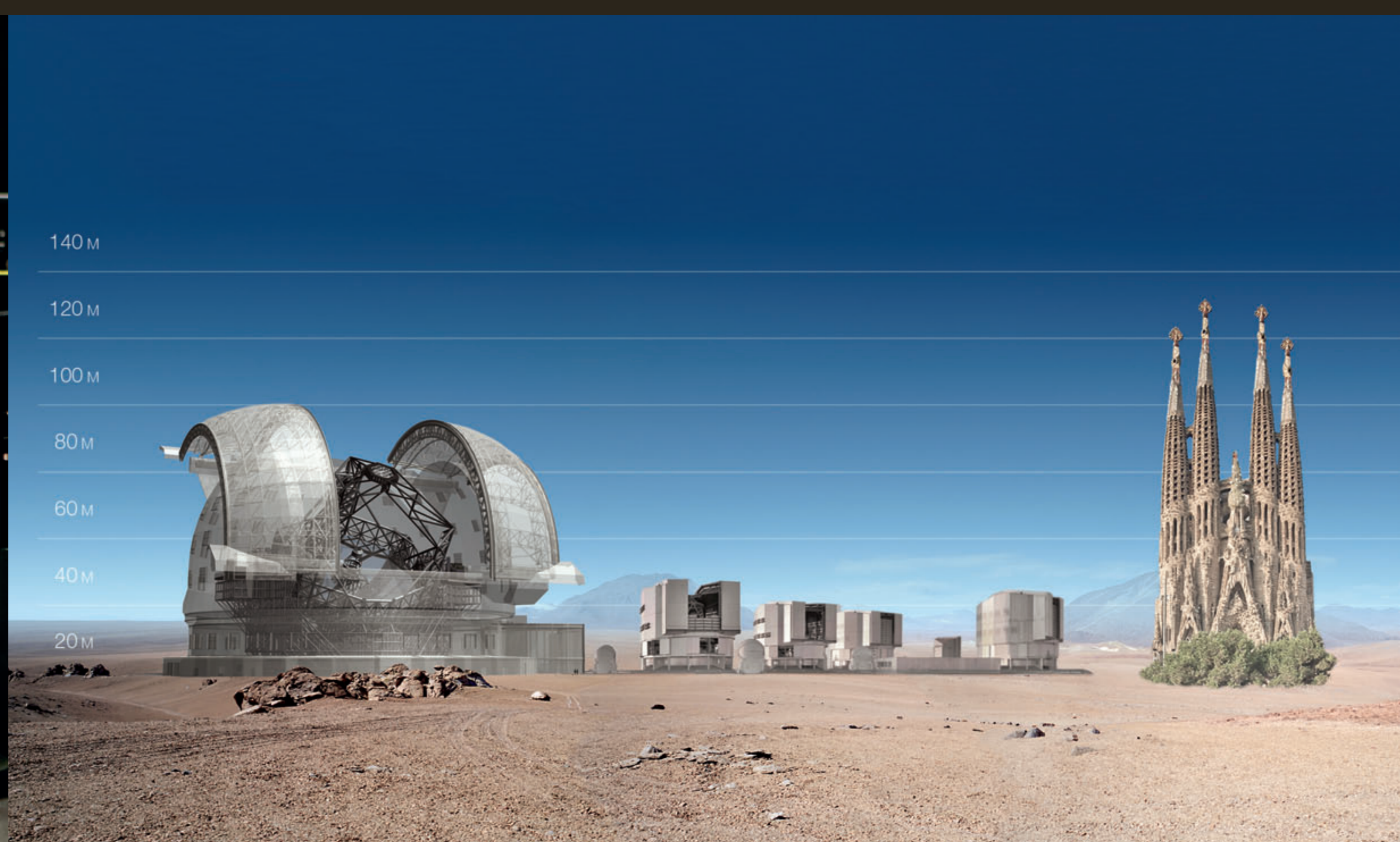
E-ELT and VLT sizes compared with the Sagrada Família.

El Experimento de Ajuste Activo, un verificador de tecnología parcialmente financiado por el 6to Programa Marco de la Comunidad Europea.