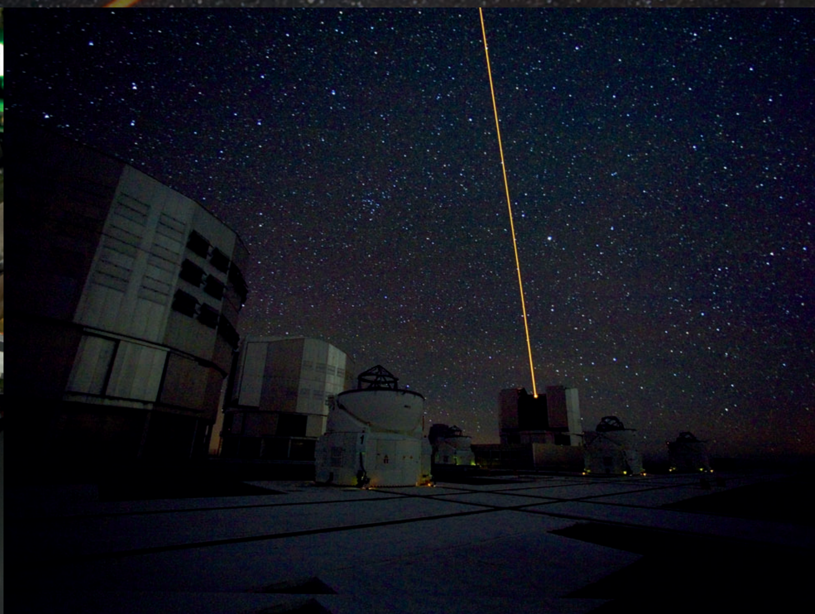
First Light of the VLT Laser Guide Star. La Primera Luz de la Estrella Guía Láser del VLT.