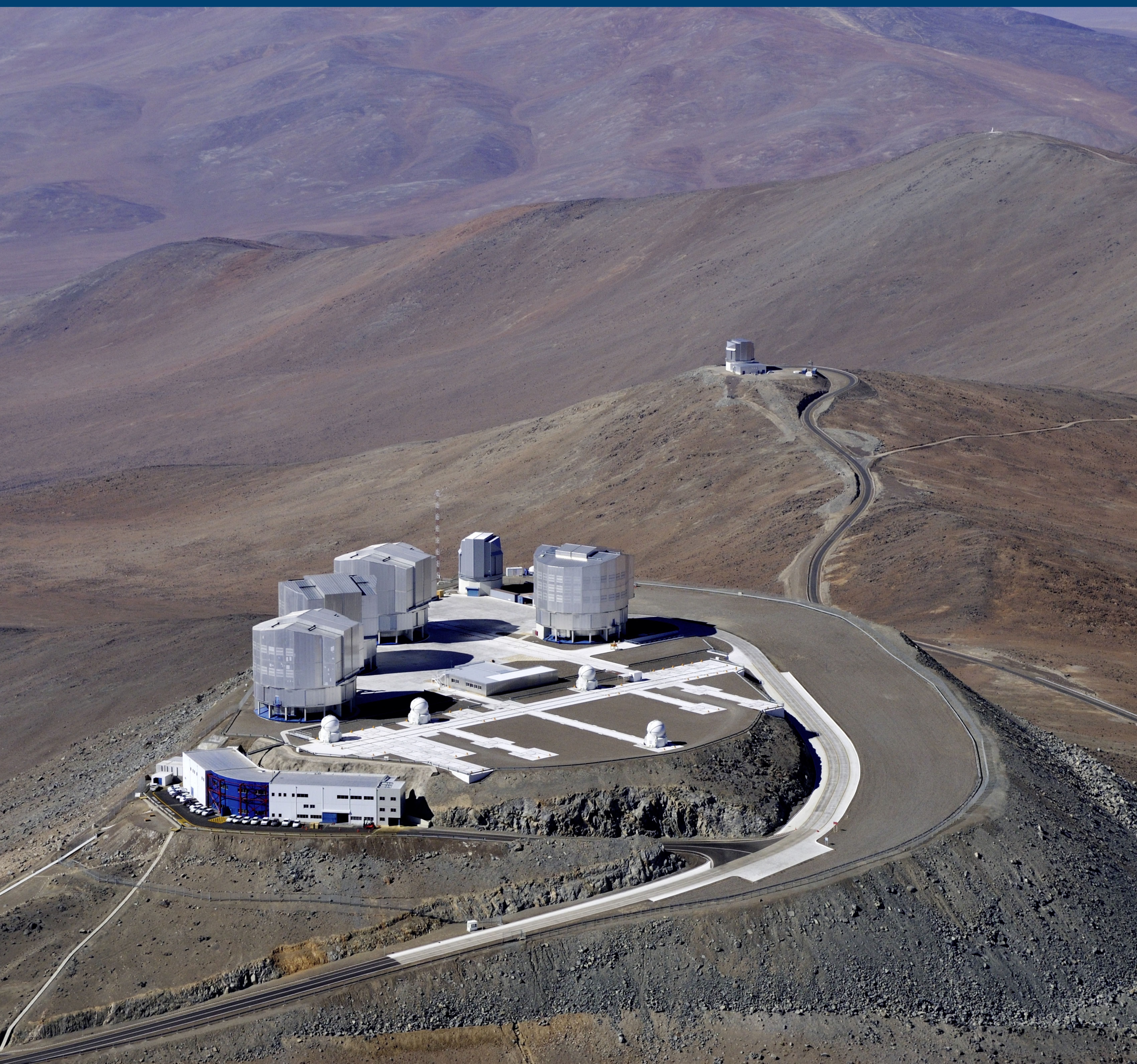
Widok na Obserwatorium Paranal z Bardzo Dużym Teleskopem (VLT).