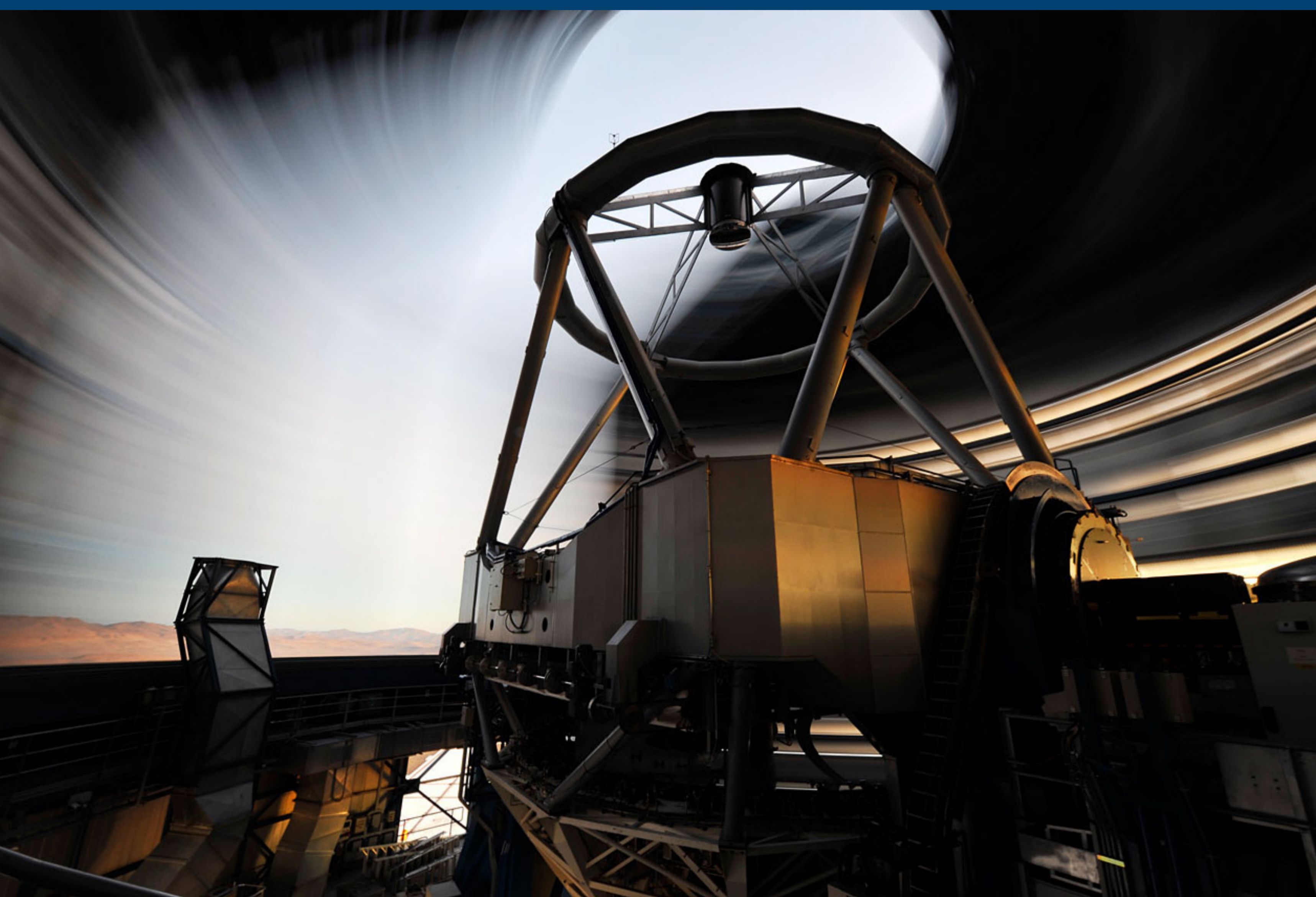
Jedno ze „Zdjęć Tygodnia”: ruch kopuły, gdy jeden z teleskopów VLT rozpoczyna pracę.

ESOcast to seria krótkich filmów, trwających od 5 do 10 minut, przedstawiających najnowsze odkrycia astronomiczne, nowe teleskopy, a także pracę astronomów „od kuchni” i codzienne życie na środku pustyni Atakama. Filmy dostępne są w różnych formatach wideo oraz spolonizowane w formie napisów.